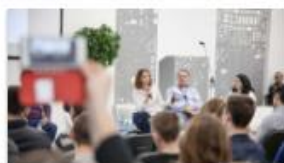
7 июня 2017 Конкурент клуб на «Бирже торгов» (Департамент г. Москвы по конкурентной политике)