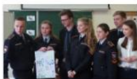
31 мая 2017 Тренинг «Основы предпринимательства и управления» (ГБПОУ Юридический колледж)