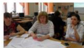
26 мая 2017 «Реализация программ реабилитационного курса для обучающихся с умственной отсталостью»