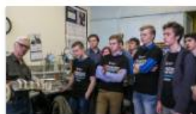
24 мая 2017 Проект «Урок в технопарке»